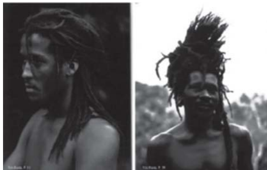
ภาพของโจทก์

ในคดี Cariou v. Prince 24 โจทก์ฟ้องว่าจำเลยนำภาพของโจทก์จำนวน 30 ภาพที่ตีพิมพ์ในหนังสือชื่อ Yes Rasta ซึ่งเป็นภาพของชนกลุ่มน้อยบนเกาะจาไมกาที่นับถือลัทธิราสต้าไปใช้โดยไม่ได้รับอนุญาตเป็นการละเมิดลิขสิทธิ์ของโจทก์ จำเลยต่อสู้โดยอ้างการใช้ที่เป็นธรรมเนื่องจากได้แปรรูปสัมบูรณ์ไปแล้ว (ดูภาพประกอบ)