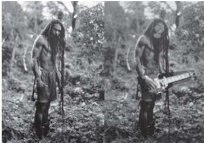
ภาพของโจทก์

30 ภาพเป็นการใช้ที่เป็นธรรมเนื่องจากมีการแปรรูปลิขสิทธิ์แล้ว ทั้งการจัดวางองค์ประกอบภาพ ลัดสวน การให้สี ส่วนอีก 5 ภาพศาลอุทธรณ์ยกย่อนำนวนให้ศาลชั้นต้นพิจารณาใหม่ว่าจะสามารถอ้างการใช้ที่เป็นธรรมได้หรือไม่ (ดูภาพประกอบ)