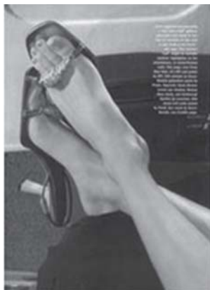
ภาพโจทก์

ภาพของโจทก์ที่ถูกละเมิดเป็นภาพถ่ายระยะใกล้ของส่วนขาที่อ่อนล้าและเท้าคู่หนึ่งของสตรีที่ทาเล็บและสวมรองเท้ายี่ห้อกุชชีที่ติดวัสดุส่องประกาย ขาทั้งคู่พาดอยู่บนดักของสุภาพบุรุษฉากหลังของภาพเป็นภายในห้องโดยสารชั้นหนึ่งของเครื่องบินโดยสาร จำเลยนำเฉพาะส่วนขาที่สวมรองเท้ามาใช้ และตัดส่วนประกอบอื่นของภาพโจทก์ออกไป ปรับทิศทางของขาเป็นแนวชี้จากบนลงล่าง เพิ่มเส้นที่ขาข้างหนึ่งและปรับเปลี่ยนสีจากภาพต้นฉบับเพิ่มภาพขนม ได้แก่ โดนัท ช็อคโกแลตและไอศกรีม ขนมแอปเปิ้ลอบลงในภาพ และยังเพิ่มขาของสตรีอีก 3 คู่ ขาคู่ที่นำมาจากภาพโจทก์เป็นขาคู่ที่สองจากซ้าย และจำเลยเปลี่ยนฉากหลังของภาพเป็นภาพน้ำตาลโนแอกว่า (ดูภาพประกอบ)