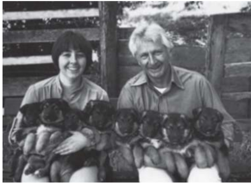
ภาพถ่ายของโจทก์