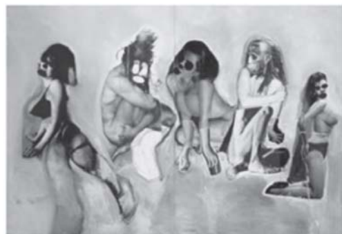
ภาพของจำเลย

(หมายเหตุ - ภาพโจทก์ปรากฏในภาพจำเลยในตำแหน่งที่สองและสี่จากซ้ายไปขวา)