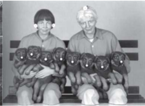
งานปั้นของจำเลย

โจทก์ฟ้องว่าจำเลยละเมิดลิขสิทธิ์ จำเลยรับว่าปั้นงานเลียนแบบภาพถ่ายโจทก์จริง แต่ต่อสู้ว่าเป็นงานล้อเลียน (parody) จึงเป็นการใช้ที่เป็นธรรม ศาลวินิจฉัยว่า งานทั้งสองเหมือนกันอย่างมากจนคนที่เห็นรู้ได้ทันทีว่าเป็นการทำซ้ำงานของโจทก์ และหากจะเป็นงานล้อเลียนก็ไม่จำเป็นต้องทำเหมือนกับงานโจทก์มากขนาดนี้ กรณีนี้จึงไม่ใช่การใช้ที่เป็นธรรม